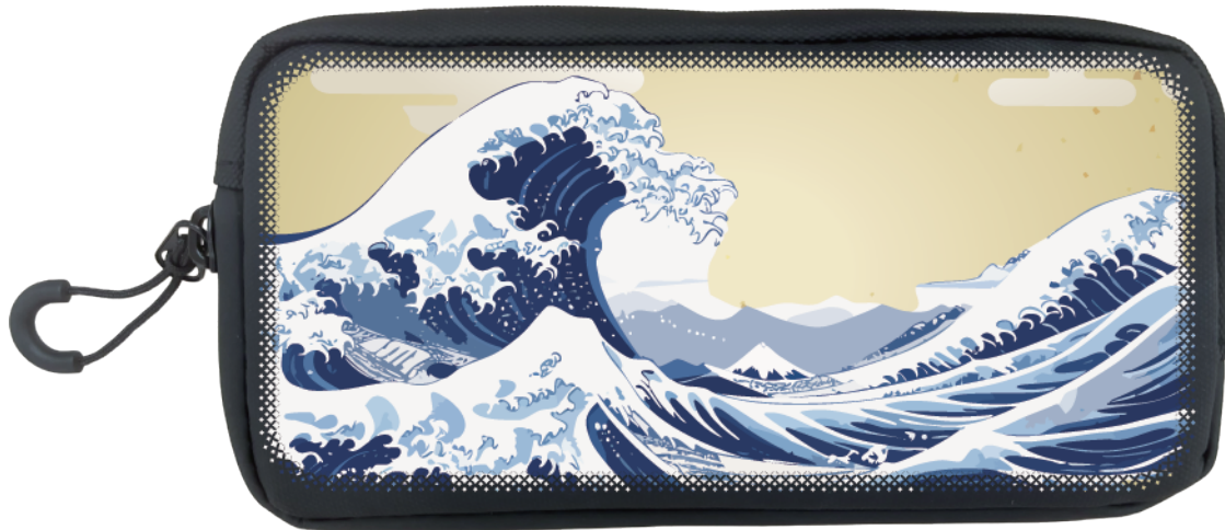
■ ダイヤグラデーション

※一面画像、もしくは上下左右にデザインが入っている場合は ダイヤ、ドット、ライングラデーションのどちらかをを推奨致します。 グラデーション無しはお勧め致しません。