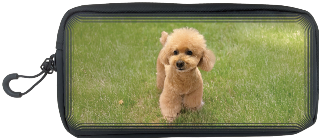
■ ライングラデーション