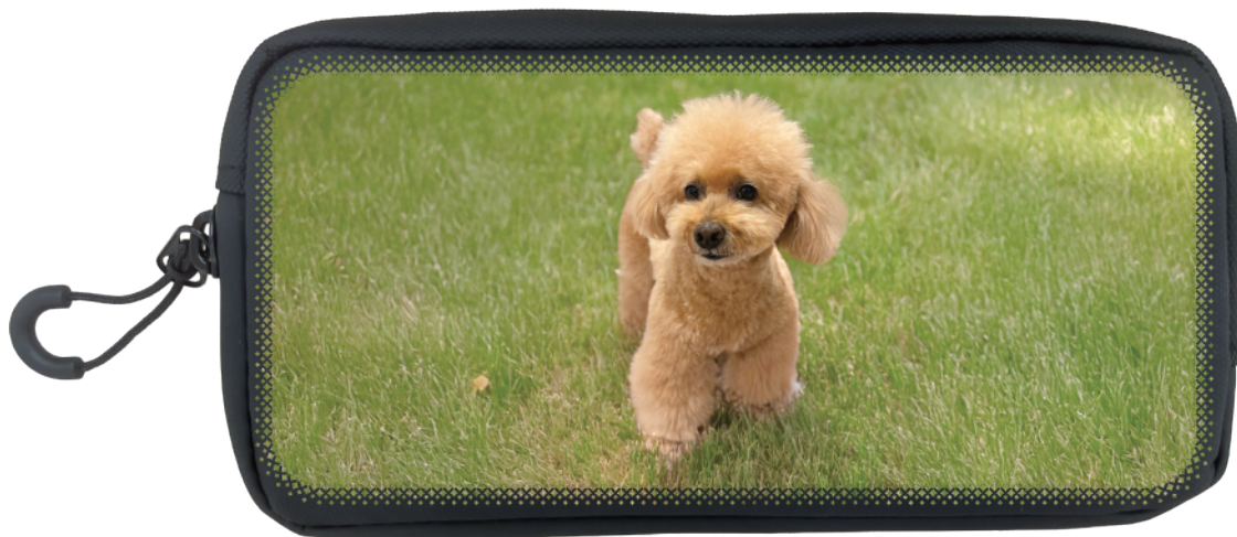
■ ダイヤグラデーション

※一面画像、もしくは上下左右にデザインが入っている場合は ダイヤ、ドット、ライングラデーションのどちらかをを推奨致します。 グラデーション無しはお勧め致しません。