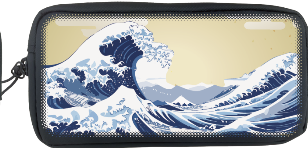
■ ドットグラデーション