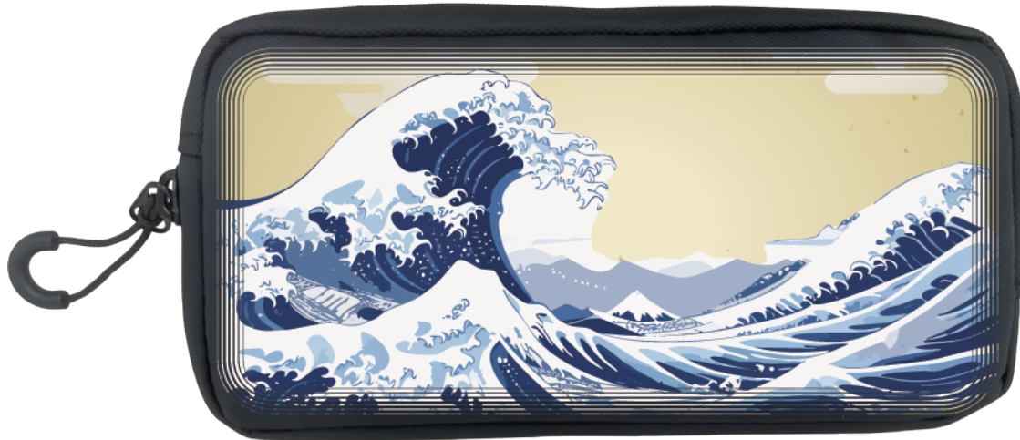
■ ライングラデーション