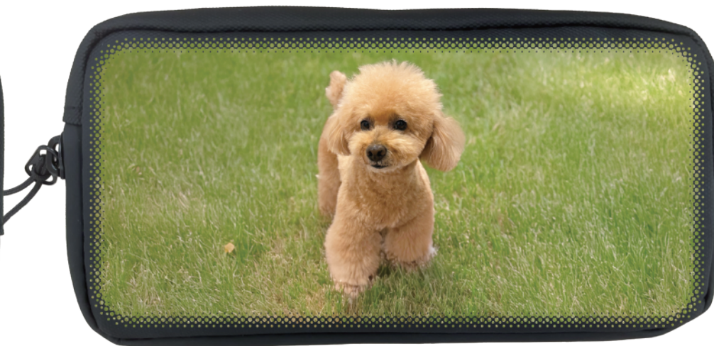
■ ドットグラデーション