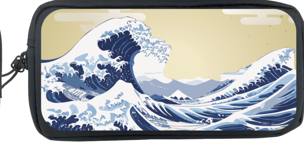
■ グラデーションなし