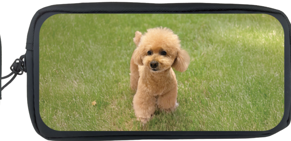
■ グラデーションなし